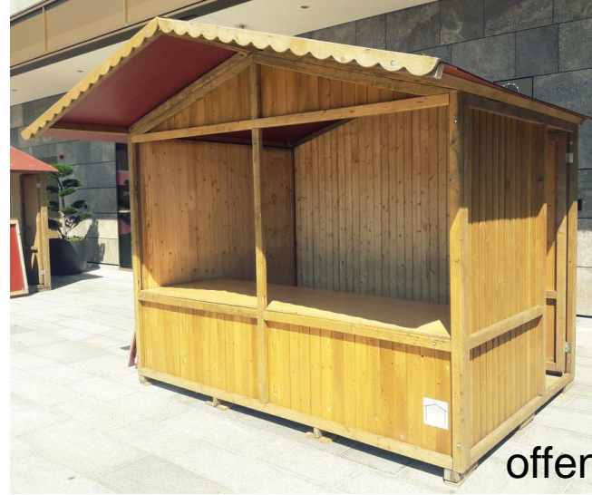
Markthäuschen offen mit Verkaufstisch