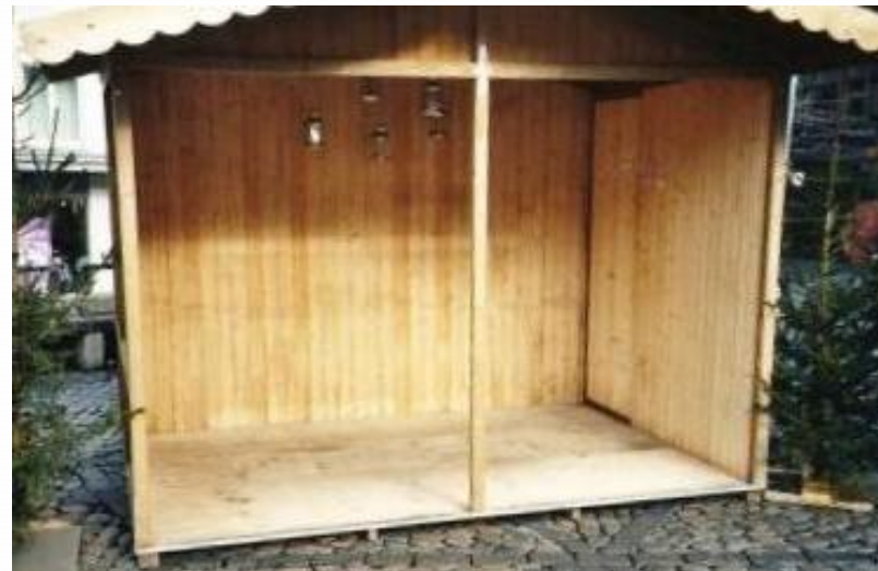
Markthäuschen mit offener, begehbarer Front